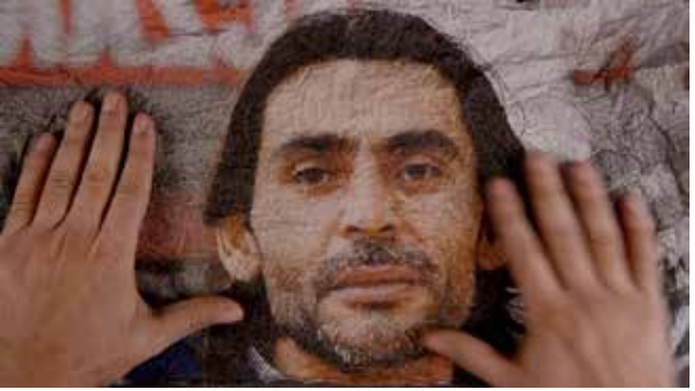
Nadschi al-Dscherf, ein syrischer Journalist der 2015 in Gaziantep/Türkei ermordet wurde.